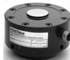
Датчик с опционным основанием

Встроенный кабель длиной 3,0 м (12ххEX-nn) <или> PC04E-10-6P стандартный разъём (12ххHL-nn) <или> PT02E-10-6P байонетный разъём (12ххBAY-nn) Установленное основание (-В добавляется к обозначению) Раззенкованные крепёжные отверстия, за исключением модели 1243