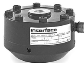
Датчик с опционным основанием

Встроенный кабель длиной 3,0 м (12ххAJ-пп) <или> PC04E-10-6P стандартный разъём (12ххAF-пп) <или> PT02E-10-6P байонетный разъём (12ххACK-пп) Установленное основание (-В добавляется к обозначению)