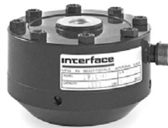
Датчик с опциональным основанием