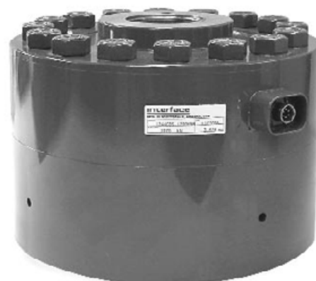
Датчик с опциональным основанием